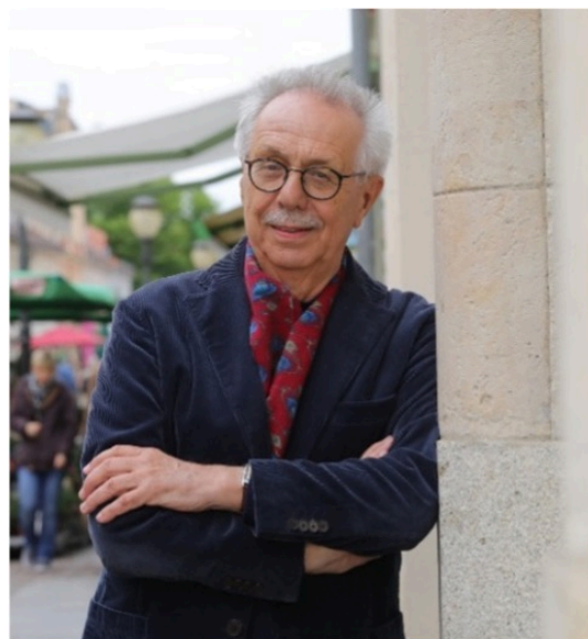
Dieter Kosslick