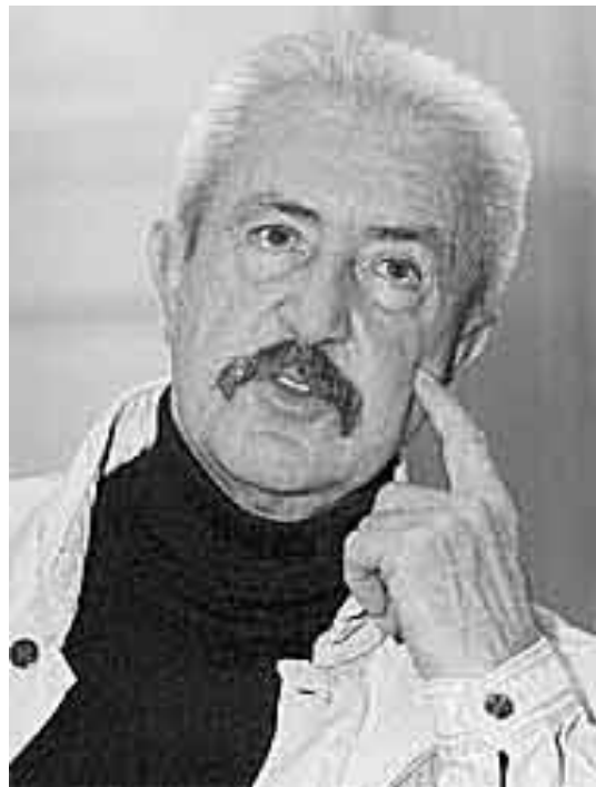
Egon Günther 1988

Am 31. August 2017 verstarb Egon Günther im Alter von 90 Jahren. Er lebte bis zu seinem Tod viele Jahre in Groß Glienicke; die Trauerfeier und Beisetzung auf dem Friedhof der Dorfkirche Groß Glienicke fand unter großer Anteilnahme von Freunden, Bekannten und Filmschaffenden statt.