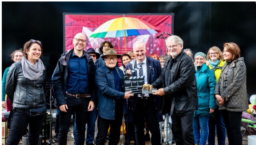
Eröffnung des 2. Drewitzer Filmfestivals 2022

Das Team um Katja Zehm vom Begegnungszentrum oskar. hatte für das 2. Filmfestival in der Potsdamer Gartenstadt Drewitz ein anspruchsvolles und spannendes Programm zusammengestellt.