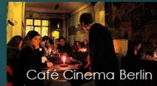
Café Cinema Berlin