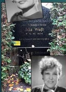
Ida Wüst * 10.10.1884 † 04.10.1958